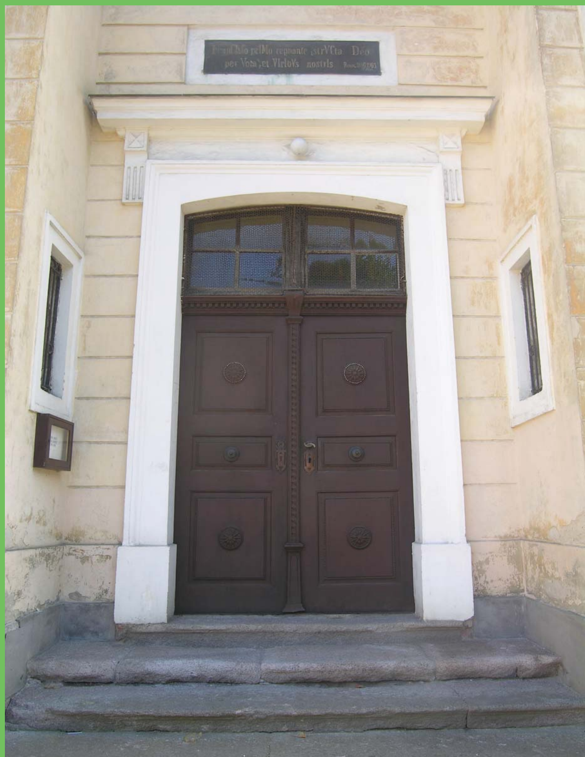
Evanjelický kostol v Kremnici - vysoké dvojkrídlové dvere so svetlíkom orámované plastickou šambránou a rímsou, dvere sú zasadené do klasicistickej fasády z prvej tretiny 19. storočia