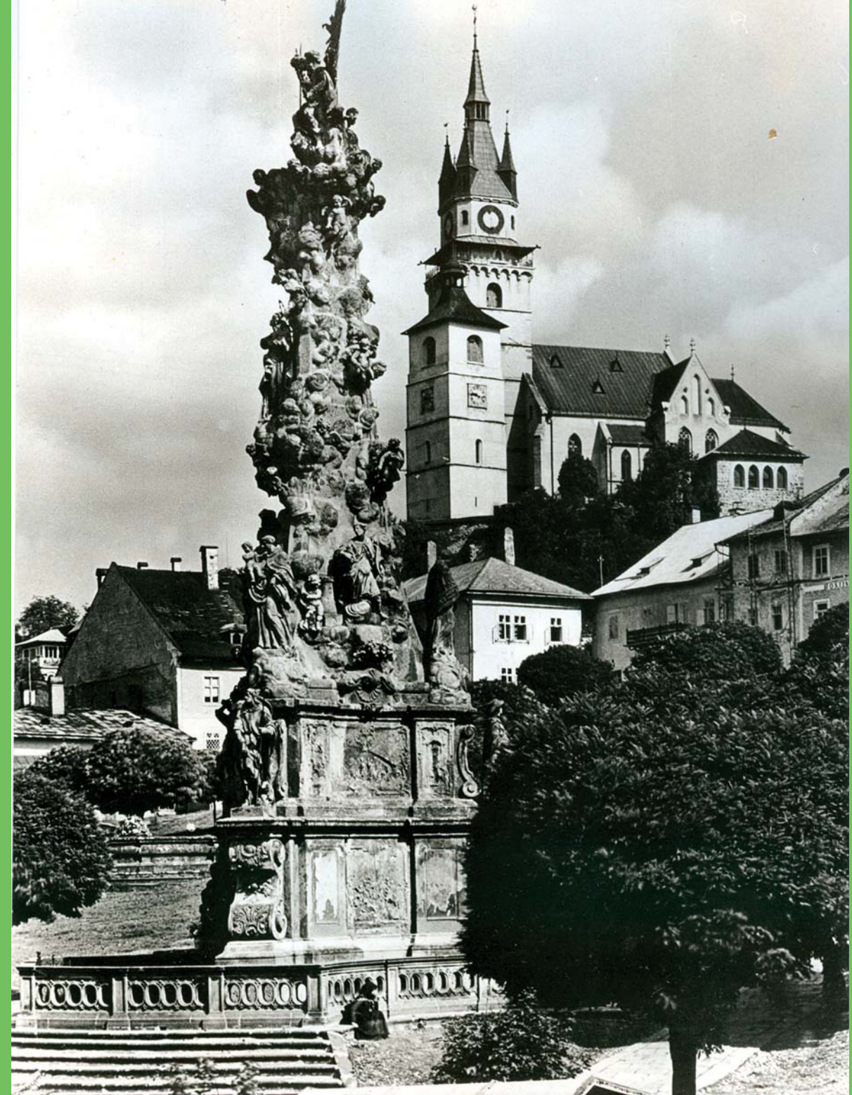
Fotografia kremnického námestia s morovým stĺpom a hradom 30. - 40. roky 20. storočia