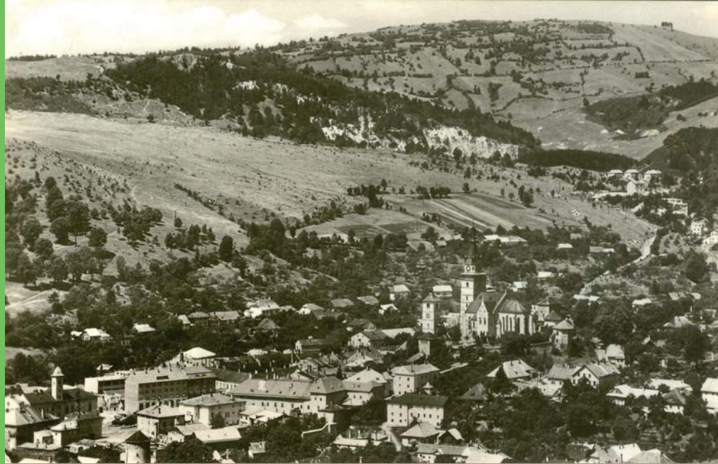
Pohľadnica Kremnice z 50. rokov 20. storočia