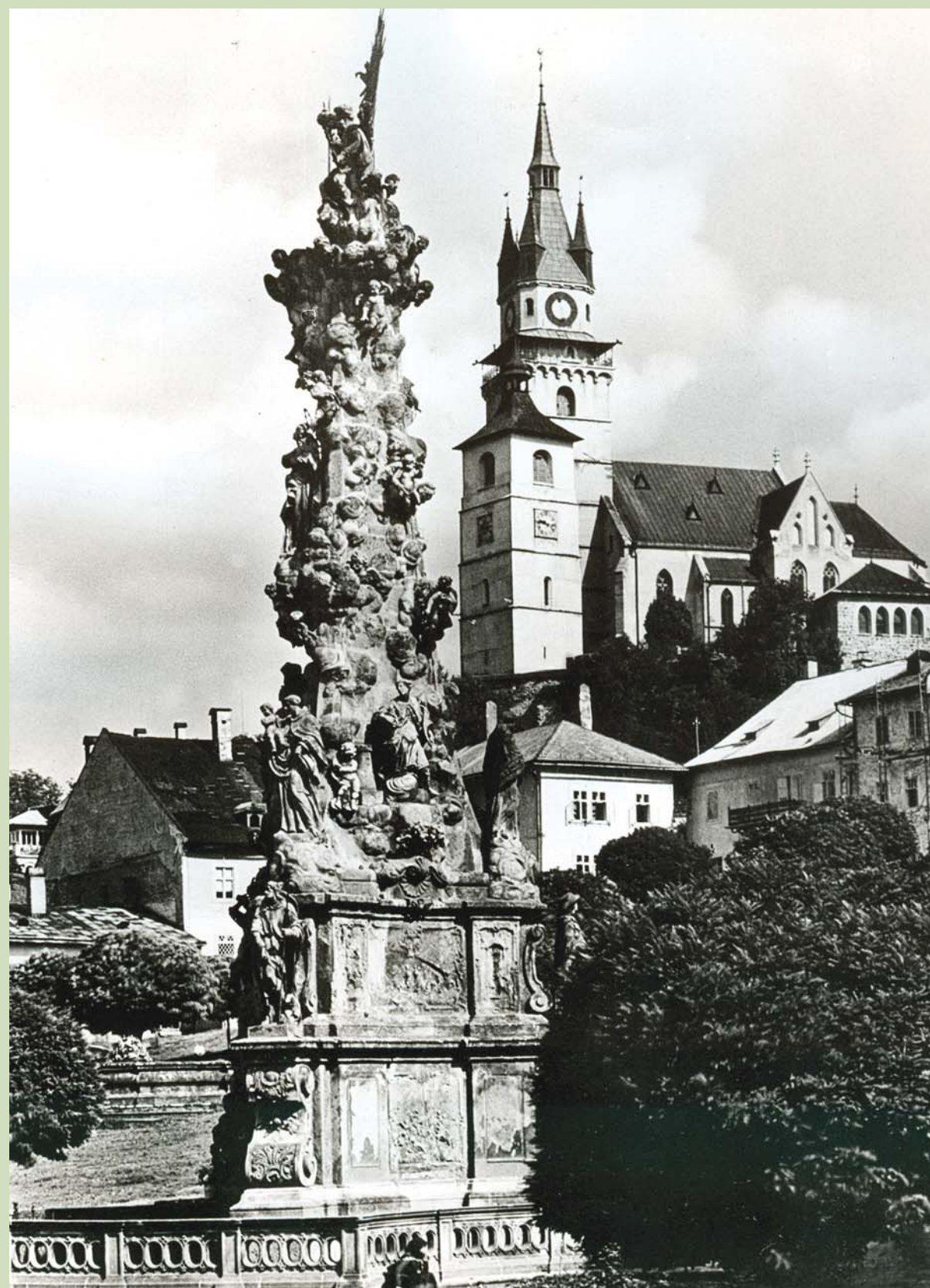
Kremnické námestie s trojičným morovým stĺpom a pohľadom na Mestský hrad, fotografia z 30. - 40. rokov 20. storočia, reprofoto Filip Lašut