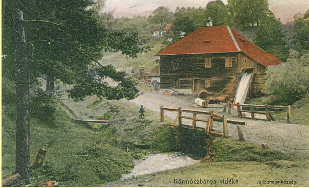
Körmöczbánya vidéke Jánoshegy-közéég.