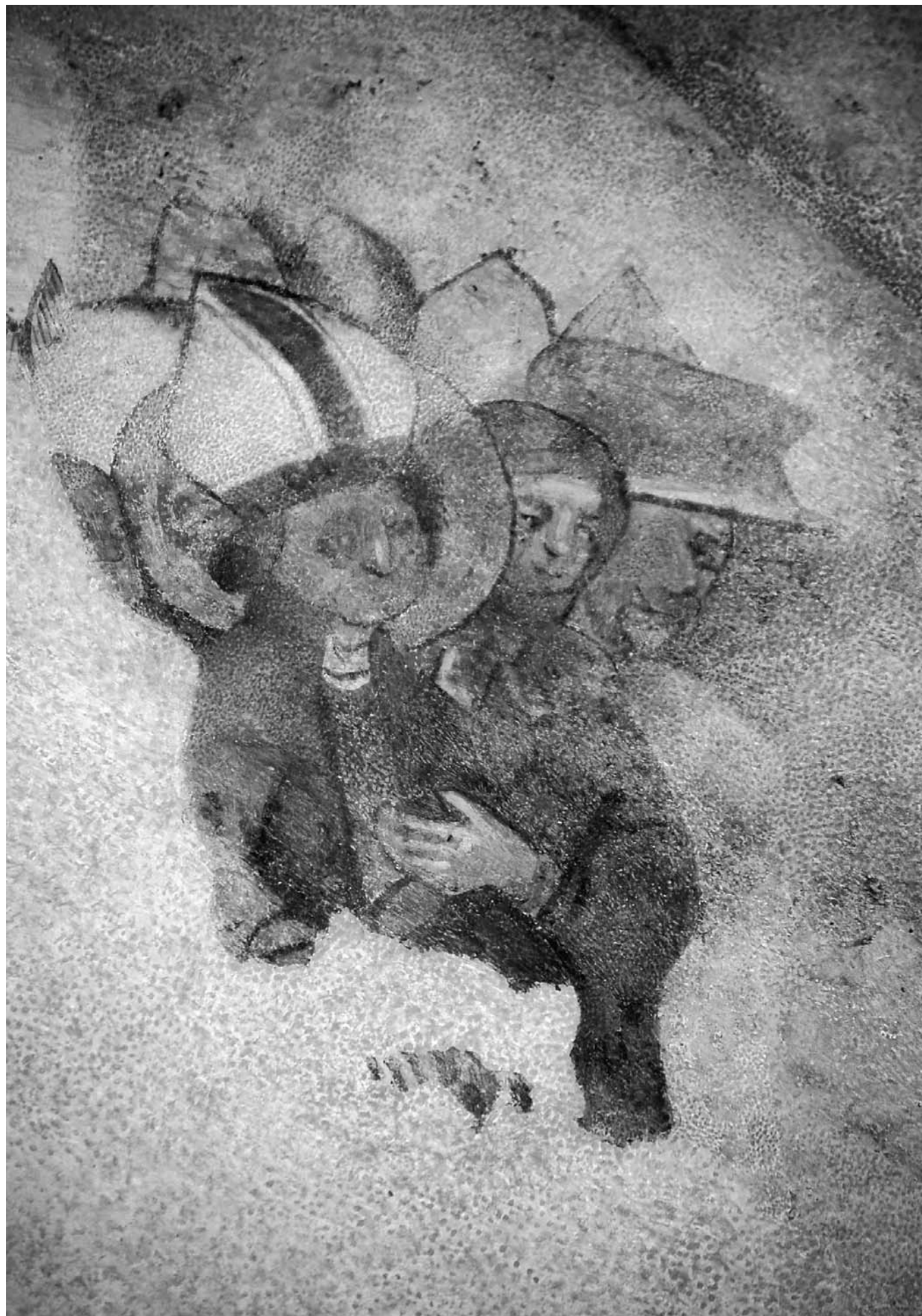
Svätý Erazmus v zástupe - freska z karnera na Mestskom hrade v Kremnici, 14. storočie