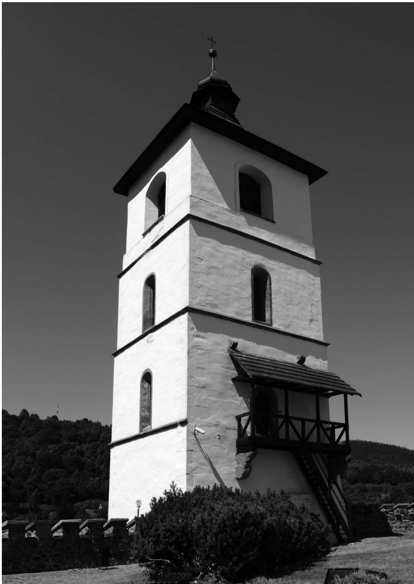
Tzv. Hodinová veža na Mestskom hrade v Kremnici, 14. storočie, foto: Matej Plekanec