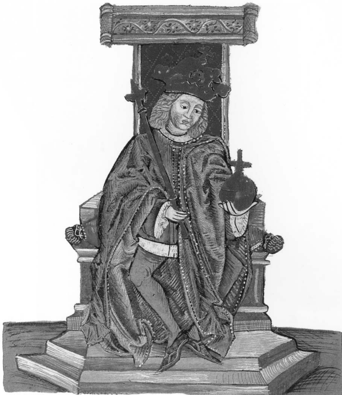
Kráľ Karol I. Róbert z Anjou, miniatúra z Kroniky Jánaz Turca, 1488

V roku 1328 získala Kremnica nasledujúce dôležité výsady – právo slobodne využívať územie v okruhu dvoch míľ (asi 17 km) právo voľby autonómnej samosprávy na čele s mestskou radou (richtár a jedenásti prisažní), právo, aby boli obyvatelia mesta súdení výlučne vlastným richtárom, ktorý bol za výkon svojej funkcie zodpovedný kráľovi a napokon právo, že mešťanov (tzv. hostí) nesmie zadržiavať nikto v krajine pre dlhy,