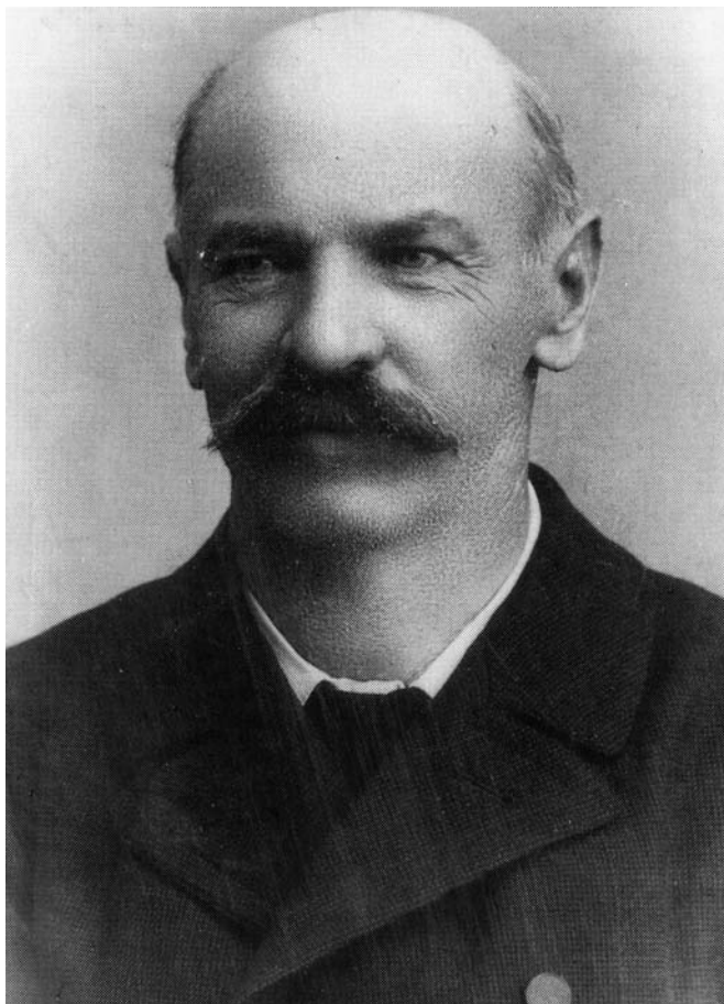
Zaujímavá podobiza Pavla Križka bez brady

Podpora rozvoja múzejníctva zo strany Pavla Križka ďaleko presahovala hranice mesta Kremnica. Pri zakladaní múzea Križko úzko spolupracoval so známym historikom, mineralógom, botanikom a múzejníkom Andrejom Kmeťom. Ich vzájomná spolupráca vyústila do založenia Múzeálnej slovenskej spoločnosti (MSS) v Martine v roku 1893. Rok predtým vypracoval Pavol Križko návrh stanov pre túto spoločnosť, a to na základe vzoru Vlasteneckého múzejného spolku v Olomouci. Andrej Kmeť navrhol Pavlovi Križkovi, aby na zakladajúcom zhromaždení spoločnosti prevzal funkciu jej predsedu. Členovia si však napokon zvolili do čela