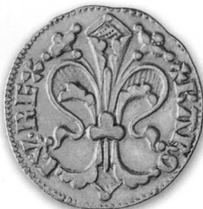
Zlatý florén Kráľa Karola I. Róberta z Anjou razený v Kremnici alebo Budíne, 1325 - 1342