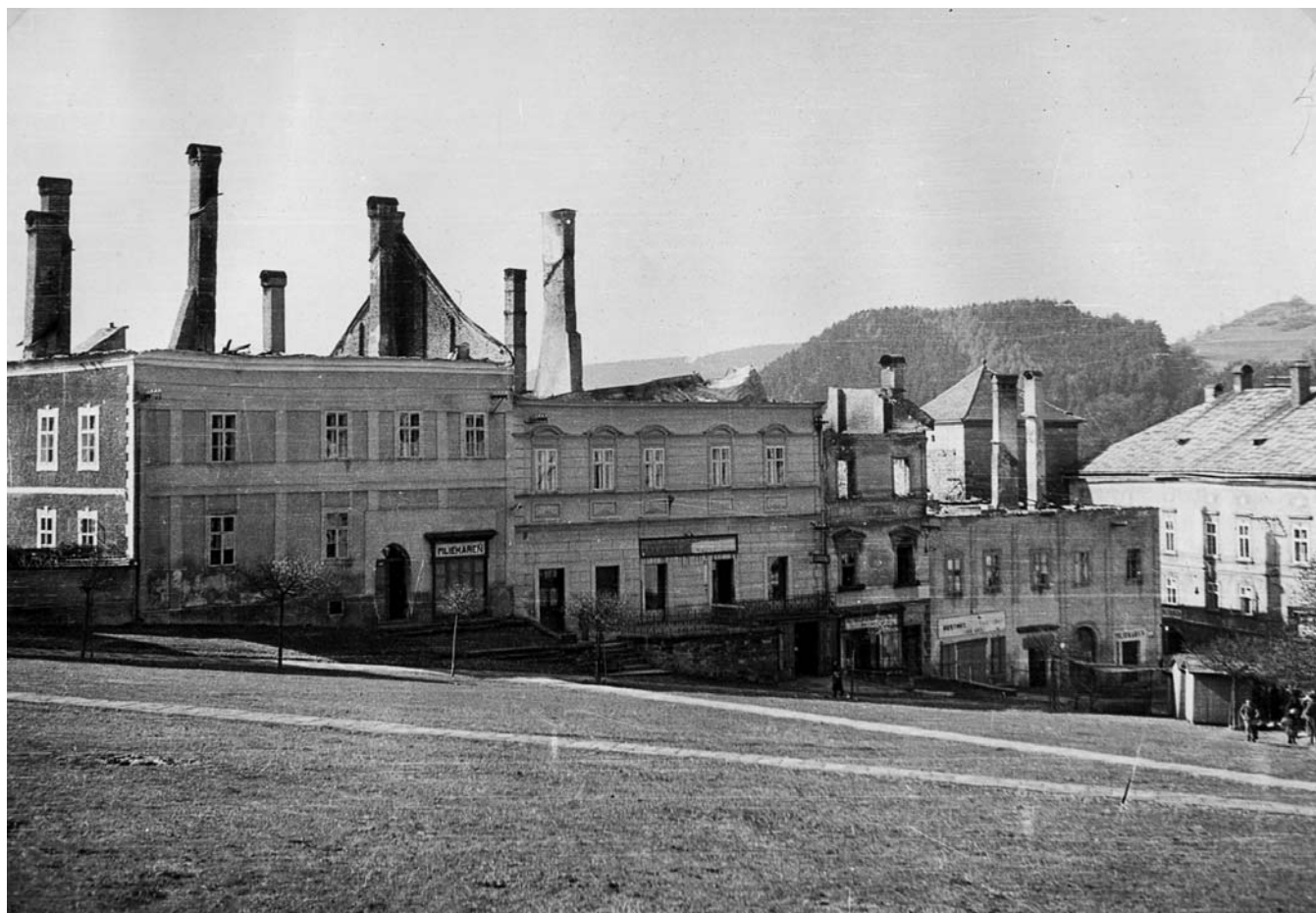
Južná strana námestia v Kremnici - vypálená ustupujúcim nemeckým vojskom, 1945