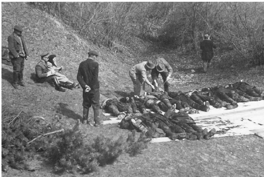
Odkrytý masový hrob pri sýpke v Kremnici, 1945 NBS-MMM Kremnica

V priebehu i po potlačení povstania sa divízie SS, nemecké vojsko ( Wehrmacht ), jednotky SD a SiPO, ako aj Pohotovostné oddiely Hlinkovej gardy a špeciálne protipartizánske jednotky ( Joseph a Edelweis ) dopustili na Slovensku mnohých krvavých zločinov. Umučili, utýrali a popravili takmer štyritisíc ľudí (3956), z čoho bolo