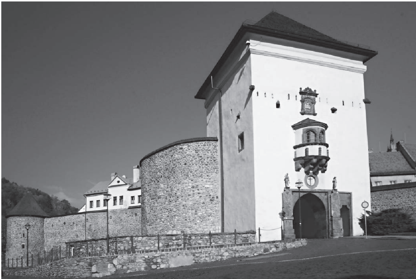
Kremnické hradby s Barbakanom Dolnej brány a Čiernou vežou

16. a prvej polovici 17. storočia existovali v Kremnici medzi obyvateľmi veľké sociálne rozdiely. K najbohatším mešťanom patrili stále ťažiar, ku ktorým sa vo väčšom pridružili solventnejší remeselníci a kupci. Strednú vrstvu dopĺňali menej solventní remeselníci, obchodníci a mestskí hodnostári. Osobitnú skupinu tvorili privilegovaní minciari. K najnižšej sociálnej kategórii prislúchali spauperizovaní remeselníci, robotníci (banskí, hutnícki, námezdní), sluhovia a slúžky, chorí a starí ľudia, ako aj ľudia z okraja spoločnosti (prostitútky, tuláci, žobráci, zločinci atď.). Nižšie zložky boli charakteristické tým, že pracovali v námezdnom pomere. Daňový súpis z roku 1542 dokladá tradičnú majetkovú prevahu mestskej elity nad ostatným obyvateľstvom. Mešťania (členovia mestskej rady a vlastníci domov na námestí) a obyvatelia kráľovského komorského dvora zaplatili spolu daň 198 zlatých a 38 denárov, väčšina