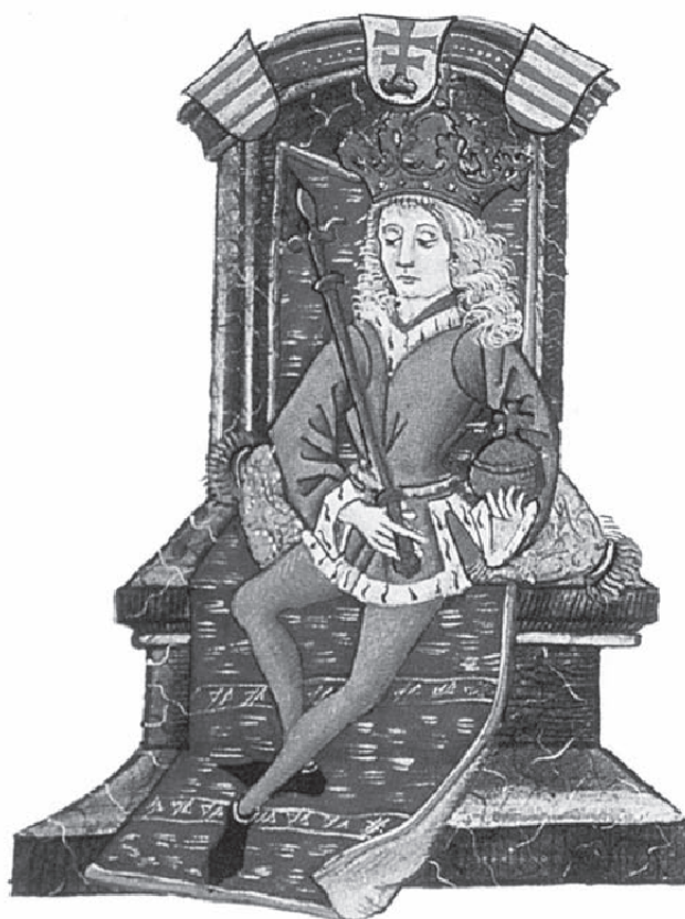
Uhorský kráľ Ladislav V. zvaný Pohrobok na miniatúre z Kroniky Jána z Turca z roku 1488, obrázok z Knihy kráľov... BA : SPN, 2006.