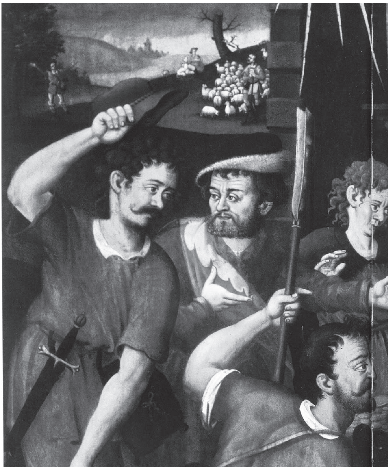
Výrez z obrazu Klaňanie pastierov z konca 16. storočia, kremnické múzeum